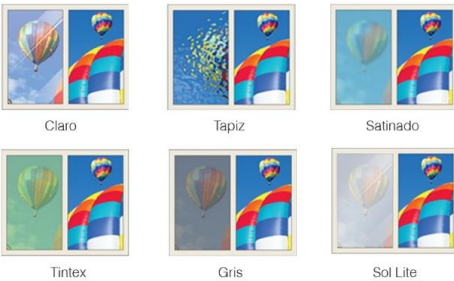
Claro Tapiz Satinado Tintex Gris Sol Lite