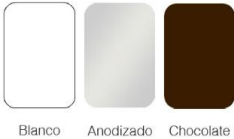
Blanco Anodizado Chocolate