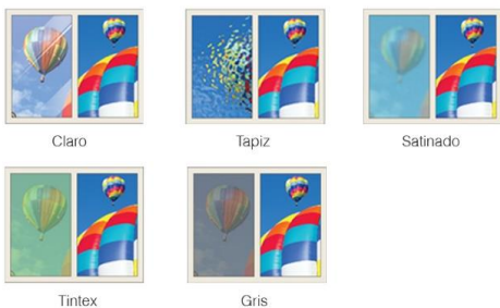
Claro Tapiz Satinado Tintex Gris