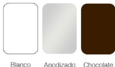
Blanco Anodizado Chocolate