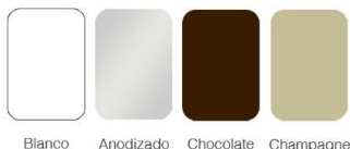
Blanco Anodizado Chocolate Champagne